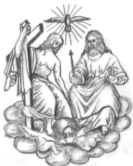
Hl. Dreifaltigkeit Ränkam