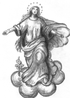
Mariä Himmelfahrt Furth im Wald